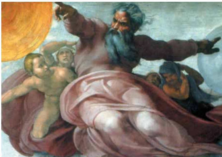
创造太阳和月亮 西斯廷教堂穹顶